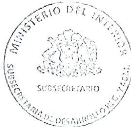
FRANCISCA ALEJANDRA PERALES FLORES